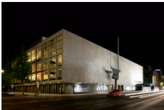
Deutsche Oper

Der Architekturführer stellt herausragende Bauten der Berliner Nachkriegsmoderne vor – ein Architekturerbe, das noch immer von Abriss oder Entstellung bedroht ist. Er vermittelt den hohen künstlerischen Anspruch dieser Baukunst sowie ihren historisch-politischen Aussagewert zur Epoche des Kalten Krieges.